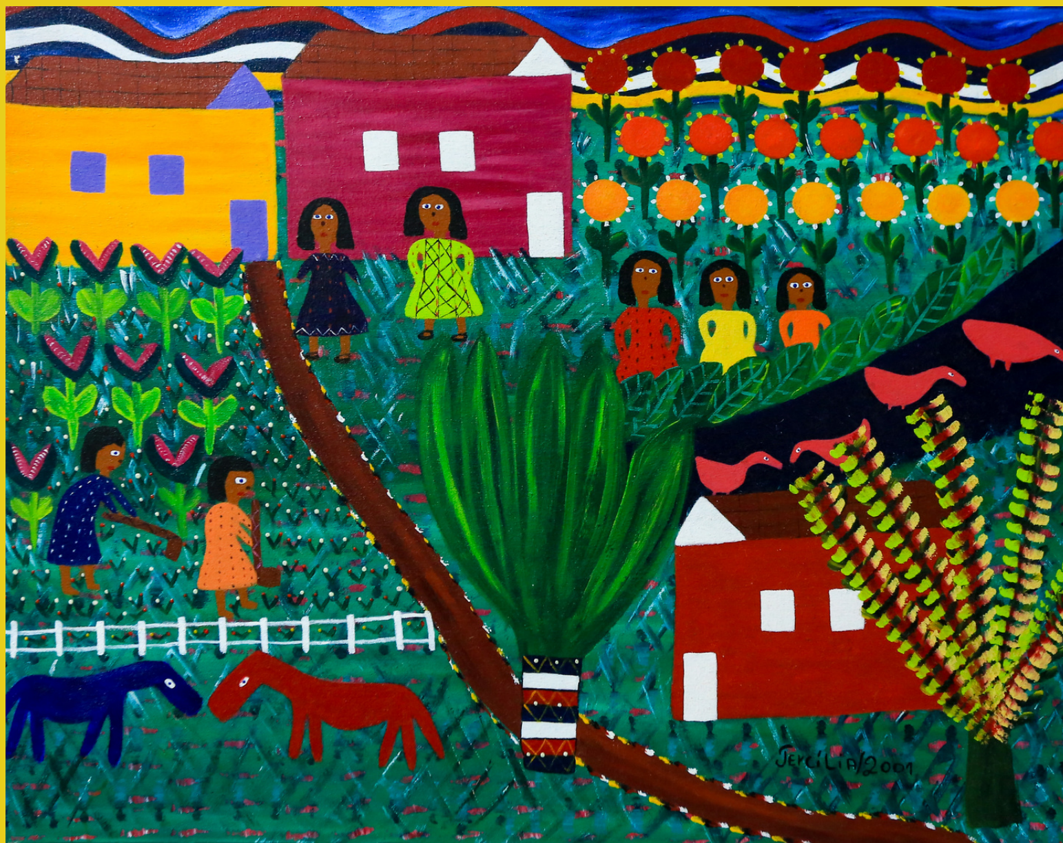
Cubinhos, 2001 - Acrílico sobre Tela - 40x50 RS - 3.400,00