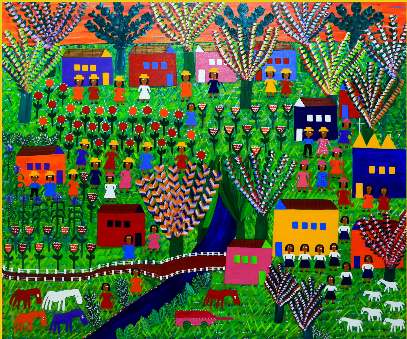
A Comunidade, 2018 Acrílico sobre Tela -100 x 120 RS - 12.000,00