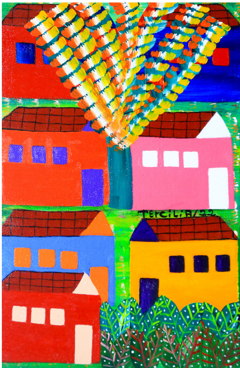
Meia Favela, 2022 - Acrílico sobre Tela - 30x20 RS - 900,00