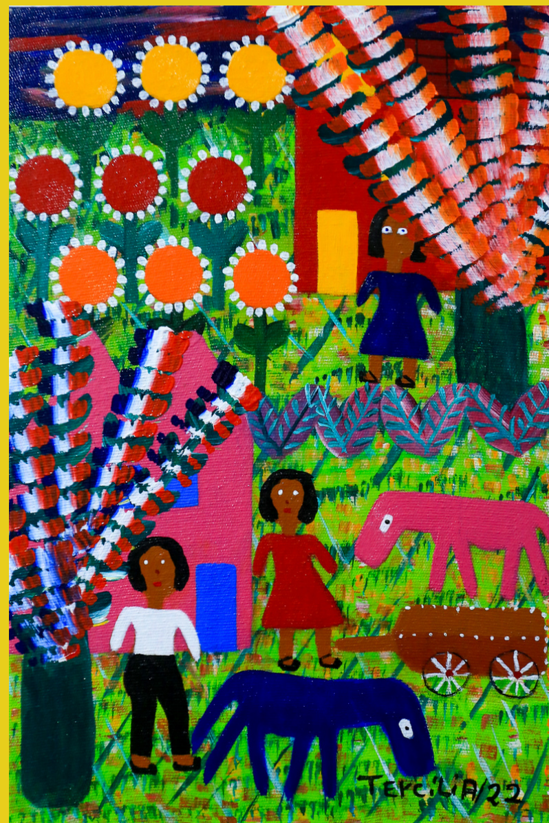
Trabalhando, 2022 - Acrílico sobre Tela - 30x20 RS - 900,00