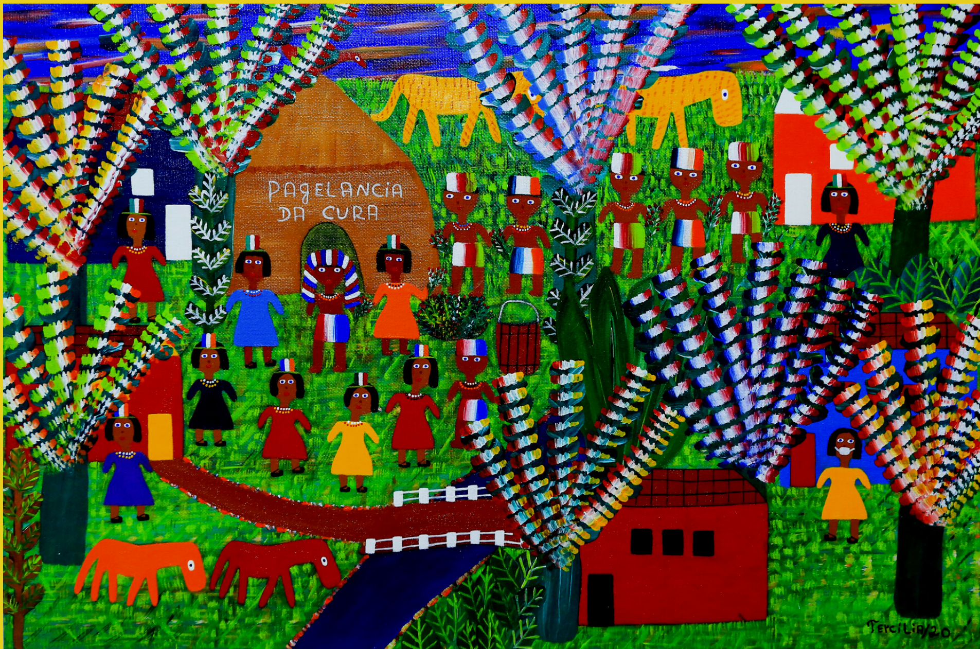
A Cura, 2020 - Acrílico sobre Tela - 40x60 RS - 3.900, 00