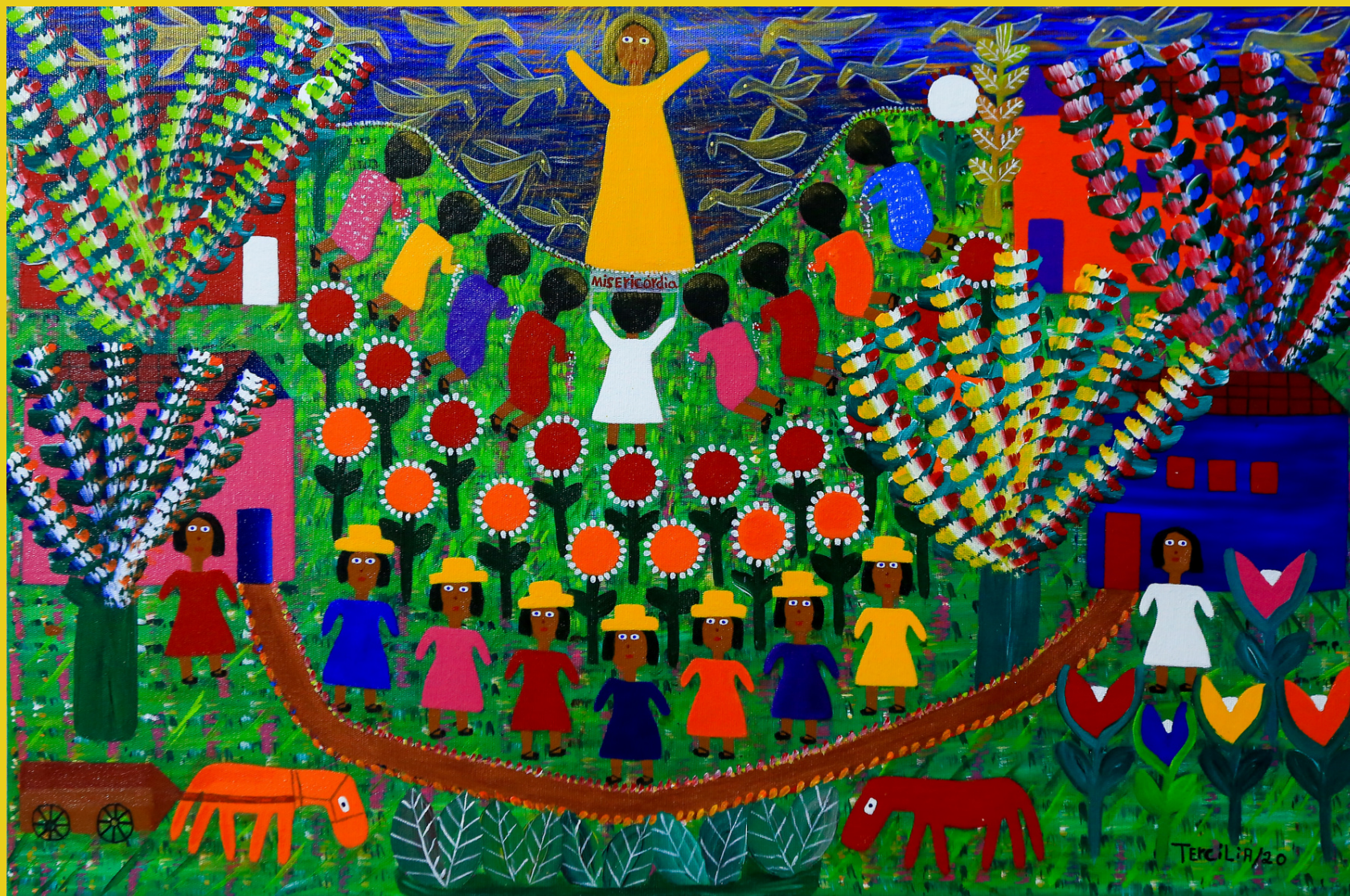
Misericórdia, 2020 - Acrílico sobre Tela - 40x60 RS - 3.900,00