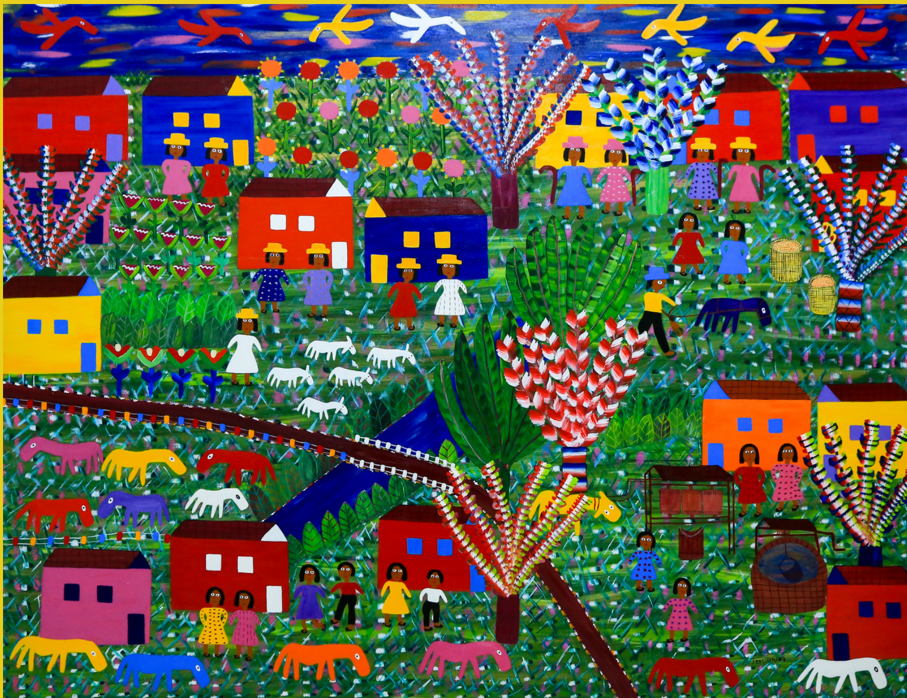
O Poço, 2007 - Acrílico sobre Tela - 100 x 130 RS - 12.900, 00